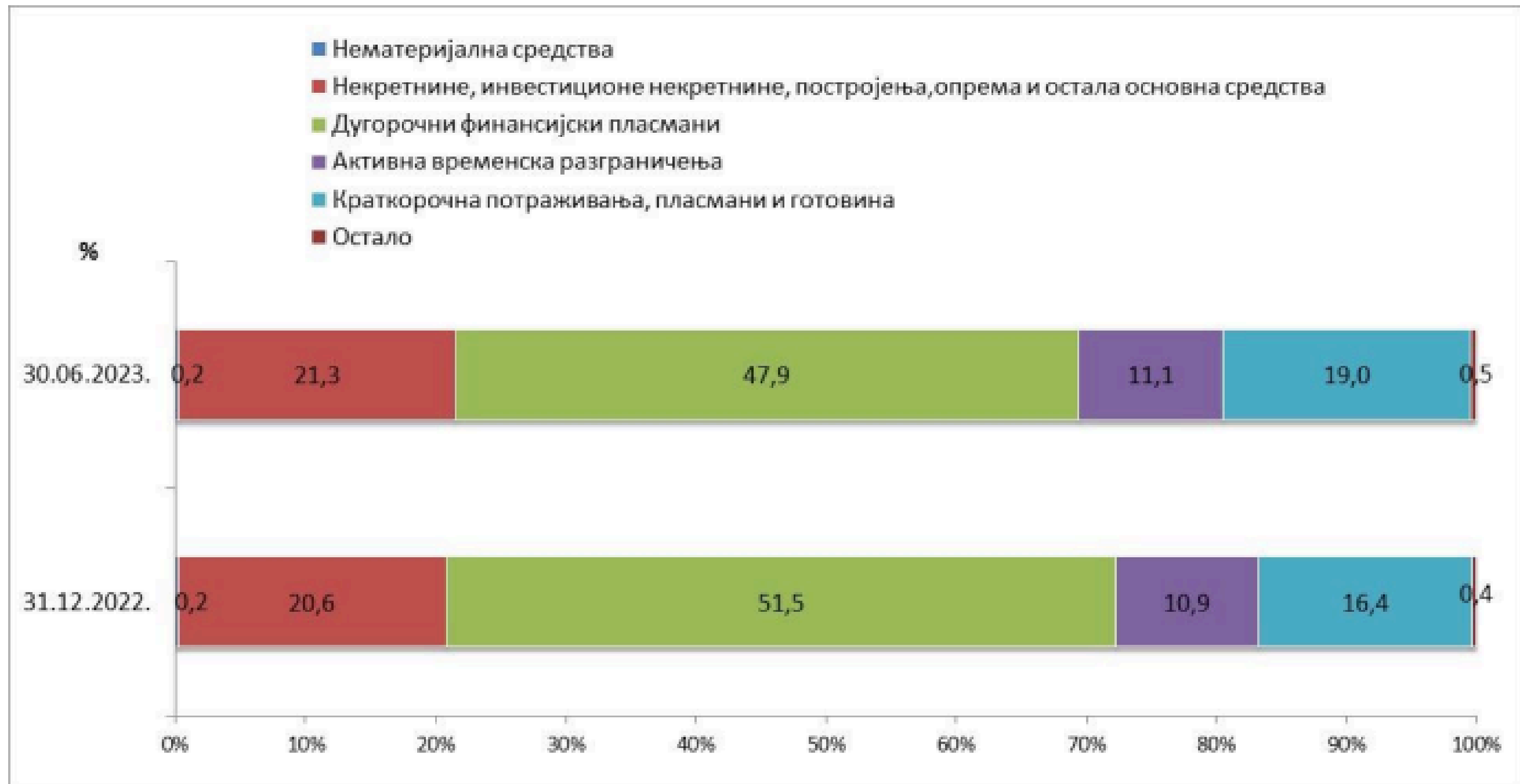
Графикон 4: Структура пословне активе друштава за осигурање из РС